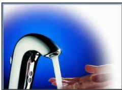
AMURA – lavabo

Lot n° 6 : Plomberie, sanitaire en standard « ROCA » De haute technologie, des séries complètes de mitigeurs et de mélangeurs à destination de la salle de bains mais aussi de la cuisine, sauront agrémenter avec style votre intérieur.