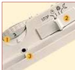
Boîtier de commandes

Evidence : faible épaisseur apparente - Les convecteurs de la gamme Evidence s'intègrent dans tous les décors.