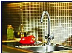
LOFT – Élite