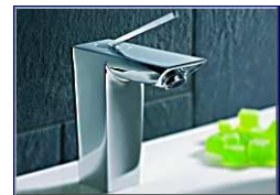
TOUCH - Lavabo

2 WC blanc complet 2 Lavabos 65 blanc avec robinetterie « ROCA » 1 Evier inox avec meuble 120x60 complets 1 Baignoire 1.70 m x 60 cm complète avec robinetterie « ROCA »