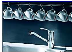
MOAI – Évier